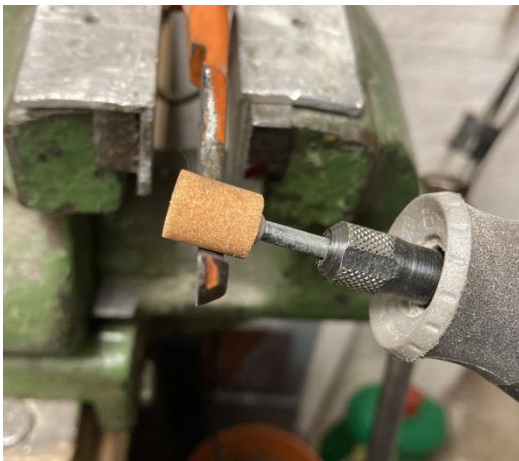
Winkel beim Schleifen beachten