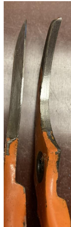
Schneiden fein geschliffen