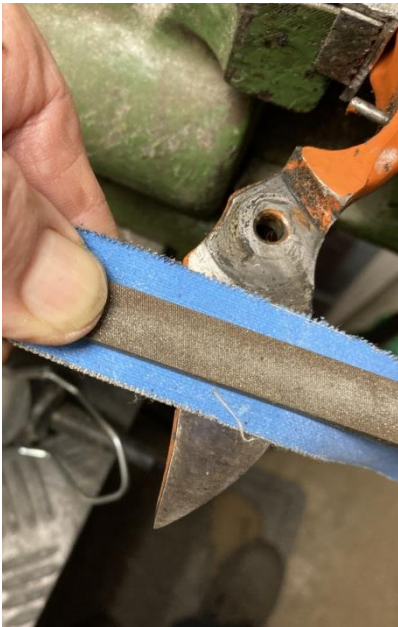
Flächen innen sauber schleifen